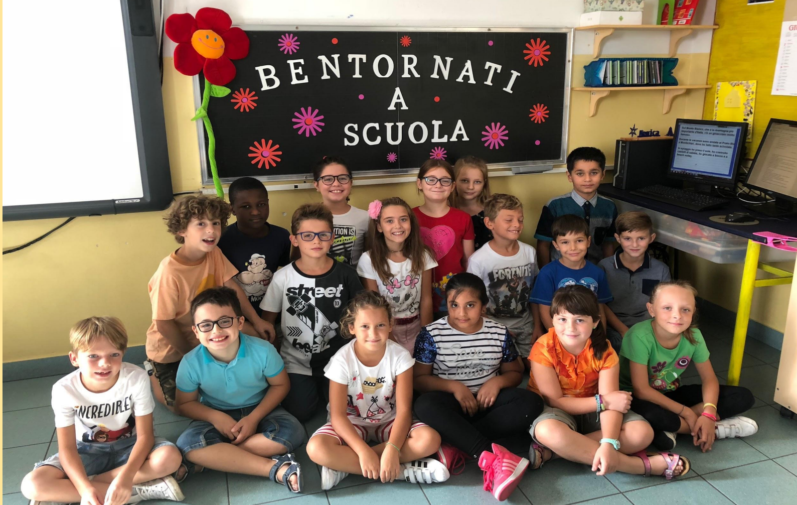
CLASSE 3 a A